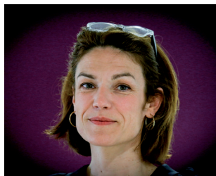
Chantal Jouanno Présidente de la CNDP