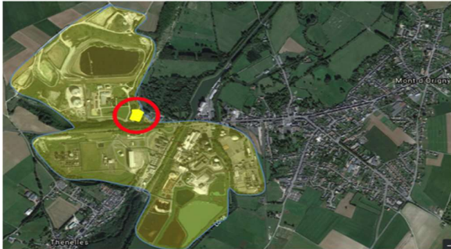
Localisation du projet de chaufferie CSR et du site TEREOS