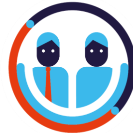
Egalité de traitement