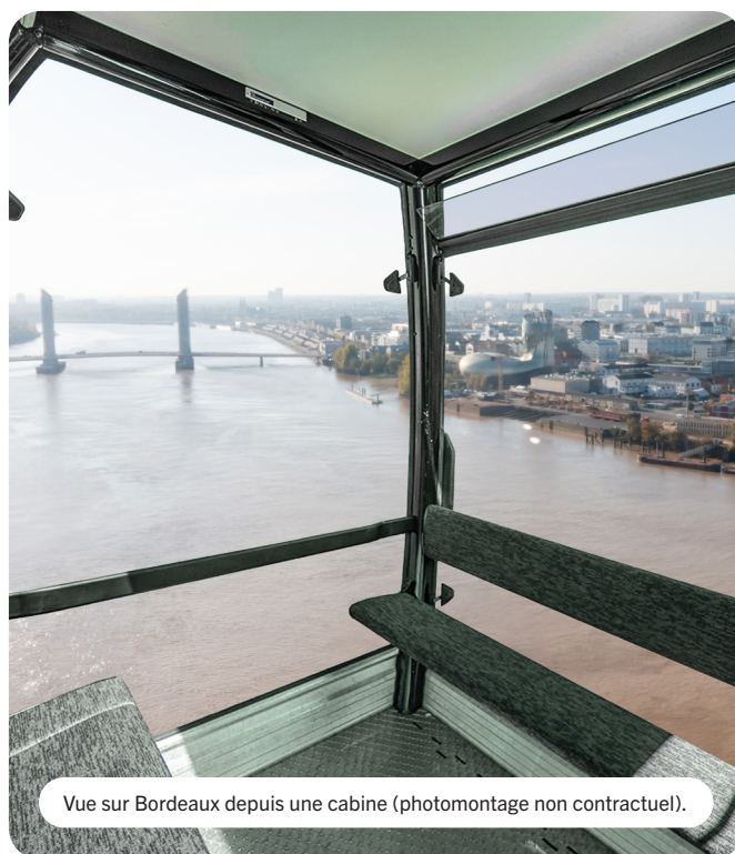
Vue sur Bordeaux depuis une cabine (photomontage non contractuel).