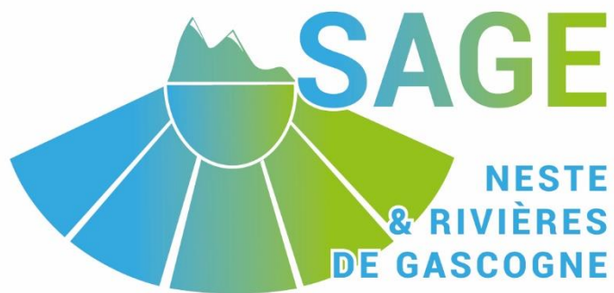
Schéma d'Aménagement et de Gestion des Eaux