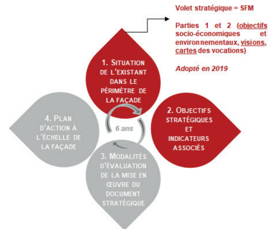
Figure 1 - Composition d'un document stratégique de façade

Les deux dernières parties constituent le volet opérationnel qui sera mis à jour ultérieurement.