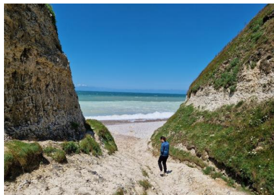
Les valleuses qui entaillent le plateau jusqu'à la mer - Le Tilleul

Les 13 valleuses du Grand Site contrastent avec les paysages ouverts du plateau et constituent les uniques accès au rivage. Elles offrent une déambulation confortable vers la mer à l'abri du vent. À l'approche du rivage, elles concentrent une expérience paysagère puissante, les escarpements calcaires et les coteaux mettant en scène de manière spectaculaire l'estran et la Manche. Une atmosphère particulière s'en dégage, un équilibre entre le cultivé, l'aménagé et le boisé.