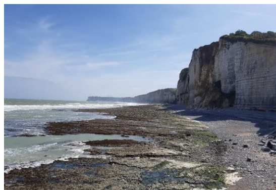
Le platier, témoin d'une érosion millénaire se couvre et se découvre au gré des marées - Yport

Un spectacle grandiose et fascinant qui a inspiré de nombreux artistes, de Claude Monet à Eugène Boudin. Ces cathédrales de craie sont le fruit de l'accumulation de strates sédimentaires puis, avec le retrait de la mer, de leur altération par l'érosion pluviale et de la formation d'argiles à silex.