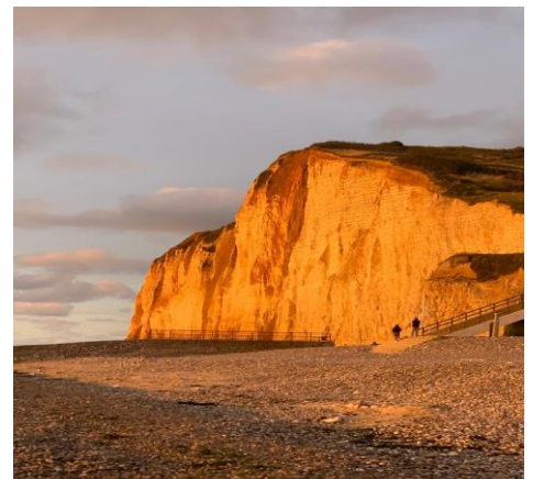
La falaise amont aux Petites Dalles