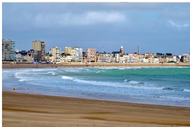
Les Sables d'Olonne - Vendée

Nous souhaitons insister sur la nécessaire concertation qui doit être opérée dans nos territoires, pour chaque projet lié à la transition énergétique. En effet, en Vendée, nous avons eu la surprise de découvrir, le 6 mars dernier, un projet initié par l'Etat, prévoyant l'implantation d'éoliennes en mer à 15 km des Sables d'Olonne et de Saint