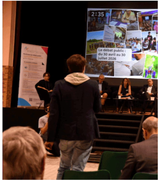
Montage photo des deux forums du 30 mai et du 5 juin

Deux forums ont été organisés à Chinon (le 30 mai) et à Villenauxe-la-Grande (le 5 juin) . Ces événements ont permis au public de rencontrer directement les acteurs du territoire — associations, institutions, organisations professionnelles... mais aussi les porteurs de projets — présents sur des stands d'information et d'échange.